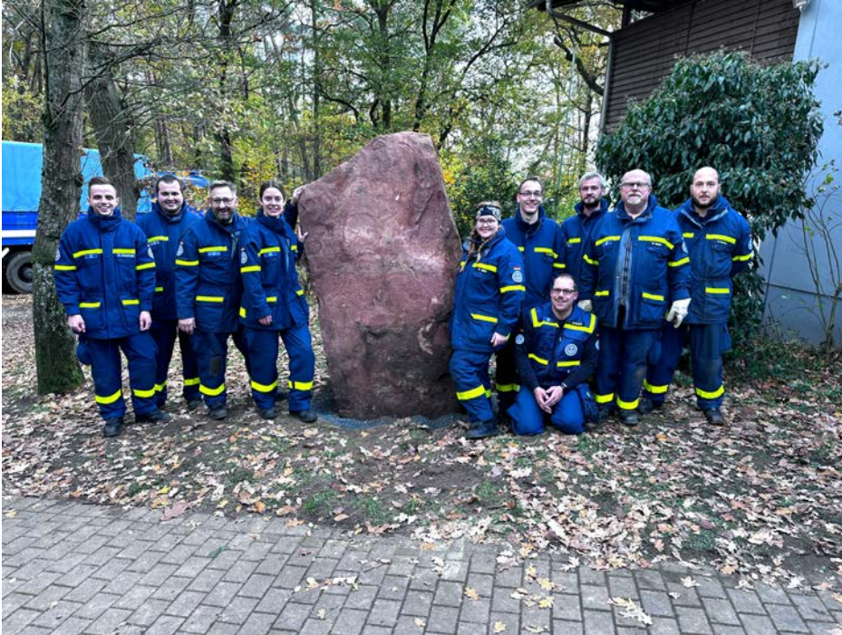
Das THW Rüsselsheim errichtet den Odenwald-Stein am NFH

Naturfreunde-Post – Ortsgruppe Rüsselsheim